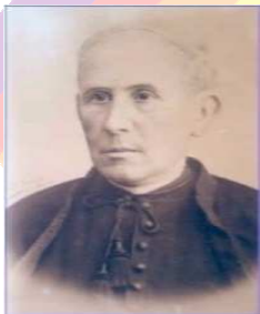
Il Padre Fondatore José Gras y Granollers

La Scuola, fondata dalle Religiose Figlie di Cristo Re, opera ad Eboli dal 1932. Alla fine del 1943, a causa dei bombardamenti che distrussero il convento, le suore dovettero lasciare la città. Il 2 novembre 1961, con la costruzione dell'attuale casa canonica, tornarono le religiose "Figlie di Cristo Re"; da allora la presenza delle religiose è stata continua fino ad oggi, sempre sotto la protezione dell'attigua chiesa di S. Maria delle Grazie. Dopo aver sospeso le attività nel 2005, la scuola ritorna ad operare nel 2008, grazie alla gestione della Cooperativa Sociale "Disegniamo un sorriso", ente nato dalla partecipazione delle religiose e parte dei laici, insegnanti e personale ATA, che operano anche presso le scuole di Salerno, ponendo un primo mattone a Eboli con l'inaugurazione del Nido d'Infanzia nel settembre 2008.