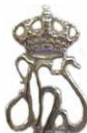
Figlie di Cristo Re