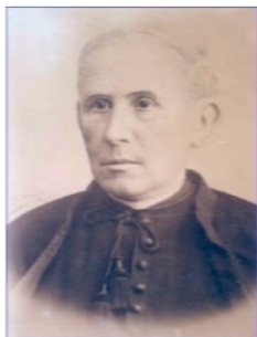
Il Padre Fondatore José Gras y Granollers

La Scuola per l'Infanzia e Primaria "CRISTORE" è presente dal 1981 in Via Moscani n. 2 a Torrione Alto, nella zona orientale della città, alla quale è collegata tramite la tangenziale e strade nazionali. La zona orientale, un tempo periferia della città, è divenuta centro di svariati interessi grazie anche al Centro Sociale che ospita numerose manifestazioni culturali, politiche, economiche e sociali. Altro importante centro d'interesse è il Forte "La Carnale" di origine normanna e di grande rilevanza storica e simbolica tanto da aver dato il nome al quartiere "Torrione" nel quale è ubicato e al quale la stessa scuola appartiene.